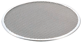
② アルミ ピザ焼網 (WPZ-02)