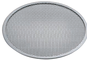
③ アルミ 丸ピザアミ パートⅡ (GPZ-20)