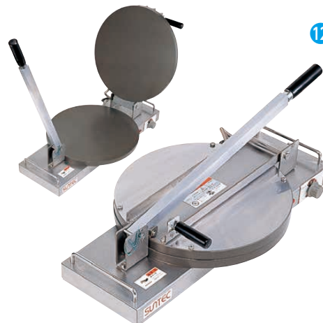
⑫ ピザプレス SDP-35 (GPZ-12) 1-0962-1201 ¥398,000