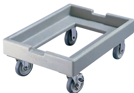
⑪ キャンブロ ピザ生地 ボックス用ドーリー CD1826PDB (グレー)