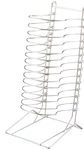
⑧ Ω 18-8 ピザパン タワー 14 (WPZ-28)