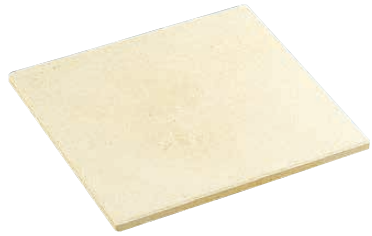
⑥ ピザストーン PS-CN