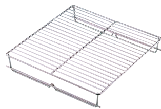
⑦ Ω 18-8 ピザパン ラック (スタッキング式) (WPZ-42)

●余分な水分と油分を吸い取るので、窯焼き風のクリスピーで香ばしい仕上がりになります。