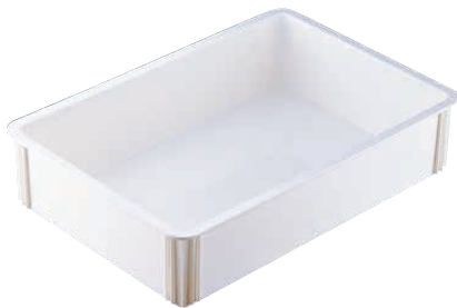
⑨ キャンブロ ピザ生地ボックス (ABT-D5)