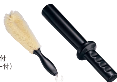
④ 洗浄ブラシ ⑤ 食材挿入棒