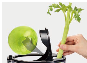
材料が丸ごと入る88mm.ワイドな投入口