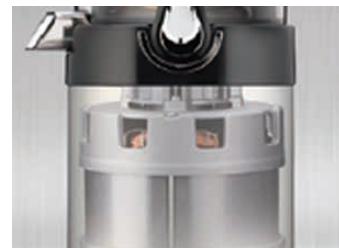
24時間連続使用可能なハイパワーモーター。