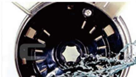
500mlの大容量ドラム。しかも簡単洗浄!