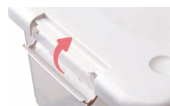
外れにくいアップロック式