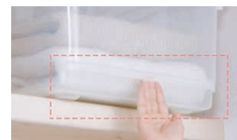
出し入れしやすいワイドな引き手。

材質:ポリプロピレン ●ケース下部に引き手がついており、出し入れがスムーズに行えます。 ●外れにくいアップロック式で、移動時や持ち上げる時でも安心です。 ●45S(ロング)のみ、前後両方から開閉可能です。