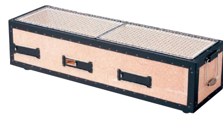
④ 炭火バーベキューコンロ BQ8T号 焼鳥用 (6~12人用) 〈DBC-23〉B 1-0773-0401 ¥56,000 770×230×H200 質量15kg 付属品:焼アミ2枚 材質:けいそう土