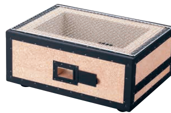
③ 炭火バーベキューコンロ BQ-12号 (4~8人用) 〈DBC-37〉B 1-0773-0301 ¥48,000 460×350×H200 質量14kg 付属品:焼アミ1枚 材質:けいそう土