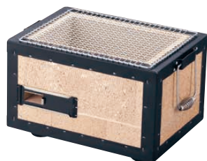
⑥ 炭火バーベキューコンロ BQ8F号 (2~4人用) 〈DBC-25〉B 1-0773-0601 ¥27,000 310×230×H200 質量6.5kg 付属品:焼アミ1枚 材質:けいそう土