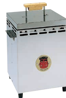
⑫ 消炭専用「消炭番」赤鬼三郎S-300 〈DKS-19〉B 1-0773-1201 ¥58,000 300×260×H425 ●残った炭を安全に保存します。又、使用した炭を仮死状態で保存しますので再利用が手間取らず、大変経済的です。