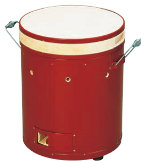
⑩ 火種コンロ 〈QTB-01〉B 1-0773-1001 ¥126,000 φ320×H400 内φ220×H165 質量:15kg ※空気調節口より送風機での送風はさけて下さい。