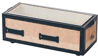
⑤ 炭火バーベキューコンロ BQ8WF号 (4~8人用) 〈DBC-24〉B 1-0773-0501 ¥42,000 540×230×H200 質量11kg 付属品:焼アミ1枚 材質:けいそう土