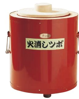
⑧ 火消しツボ (珪藻土) 〈QHK-29〉T 1-0773-0801 ¥94,000 φ323×H423 内φ245×H245 質量:13kg ●炭の節約と火消しに便利です。

●珪藻土は、淡水・海水に生じる植物性プランクトン珪藻の遺骸である珪殻 (SiO 2 ) 質の殻がそのまま海底や湖に沈み、堆積してできた土です。火に強く、断熱性に優れた素材です。