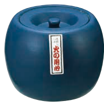
⑬ 陶器 火消し壺 丸 〈QHK-03〉B 1-0773-1301 特大 φ270×H220 ¥12,000 1-0773-1302 大 φ250×H200 ¥10,600 1-0773-1303 中 φ220×H185 ¥9,800 1-0773-1304 小 φ210×H170 ¥9,000 材質:けいそう土