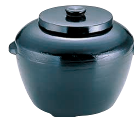
⑮ ダルマ火消 〈QHK-31〉B 1-0773-1501 大 C12-1 φ340×H250 ¥14,600 1-0773-1502 小 C12-3 φ275×H210 ¥11,600 材質:けいそう土