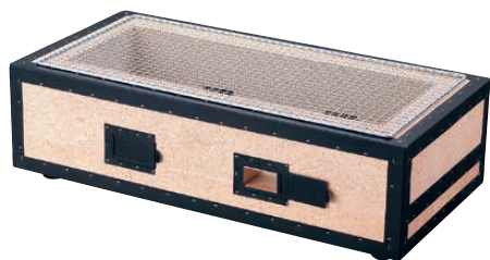
② 炭火バーベキューコンロ BQ-17号 (6~12人用) 〈DBC-38〉B 1-0773-0201 ¥68,000 690×350×H200 質量20kg 付属品:焼アミ1枚 材質:けいそう土