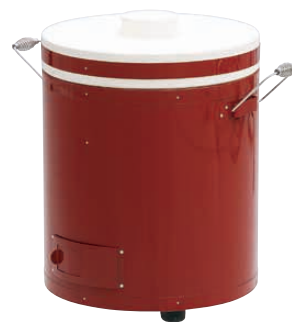
⑦ SN火種コンロ 〈DHD-02〉T 1-0773-0701 ¥99,000 φ350×H430 内φ215×H195 質量:19kg ※空気調節口より送風機での送風はさけて下さい。