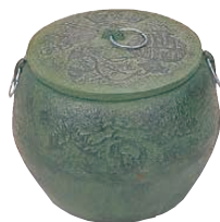
⑭ 鉄鋳物 火消し壺 〈QHK-28〉B 1-0773-1401 特大 φ260×H205 ¥31,000 1-0773-1402 大 φ230×H180 ¥23,000