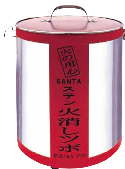
⑨ 18-0 火消しツボ KN-F30 〈QHK-34〉B 1-0773-0901 ¥49,500 φ295×H420 内φ235×H335 質量:8.4kg ●ステンレス製なので、耐久性に優れています。 ※炭を入れた直後は本体表面が熱くなる為、触れないで下さい。

●珪藻土は、淡水・海水に生じる植物性プランクトン珪藻の遺骸である珪殻 (SiO 2 ) 質の殻がそのまま海底や湖に沈み、堆積してできた土です。火に強く、断熱性に優れた素材です。