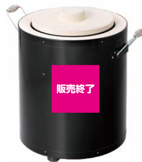
⑪ 大型火消しツボ C-17 〈DHK-04〉B 1-0773-1101 ¥124,000 廃盤 φ320×H360 内φ210×H220 質量:11kg