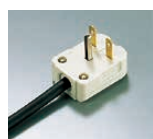
JNO-B361 コンセントプラグ 単相 200V 15A ㊦ 接地極付 コンセントです。