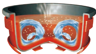
※このイラストはイメージ図です。