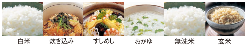
白米 炊き込み すしめし おかゆ 無洗米 玄米