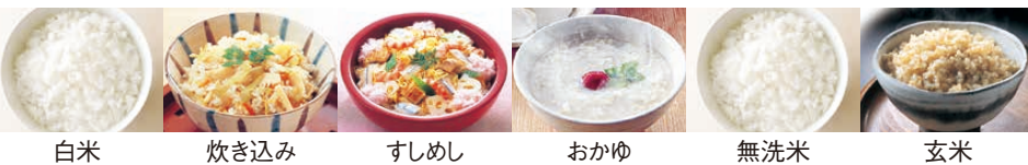
白米 炊き込み すしめし おかゆ 無洗米 玄米