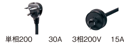
単相200 30A 3相200V 15A