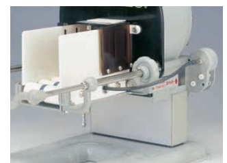
③ジョイントワイヤーを厚み調整の任意の番号にセットする。スイッチを押す(電動)またはハンドルを回す(手動)とネギが自動に送り込まれ設定した厚みにネギが切れます。