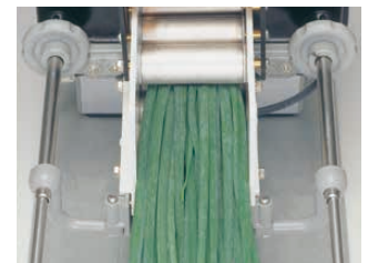
②ウェートとコンベアーの間にネギを差し込む(なるべく奥まで)