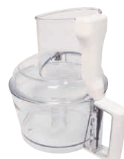
RM3200用 FAフレアセット 〈CLB-21〉 1-0649-0734 ¥26,600

RM-○200VDシリーズでのディスクの使用・取付方法は、P.2654資料集10をご参照ください。