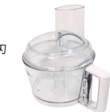
RM3200用 VDフレアセット 〈CLB-21〉 1-0649-0733 ¥21,500