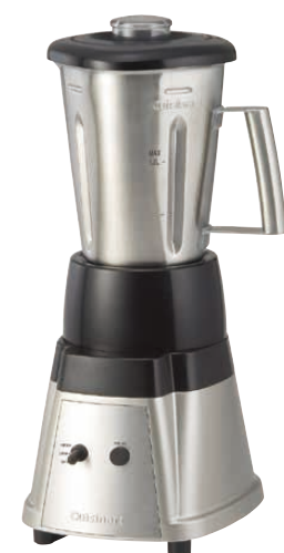
④ クイジナート ハイスピードプロセッサー ホットブレンダー CBT-500PRO2 <FBL-24> G 1-0648-0401 ¥60,000

191×218×H440 ボトル容量:1.5ℓ(ステンレス) 定格電圧:単相100V 50/60Hz 消費電力:270W 処理容量:最大1.0ℓ 最小0.2ℓ(お粥の場合) 攪拌2段切換:高速 18,000r.p.m 低速 15,000r.p.m パルス18,000r.p.m