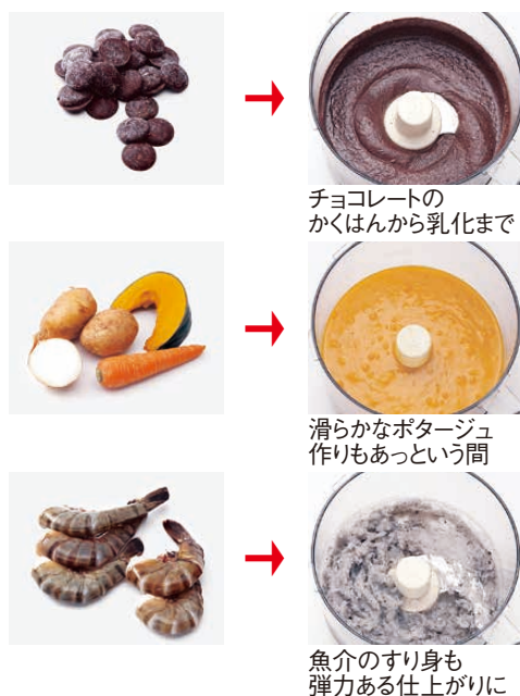
チョコレートのかくはんから乳化まで