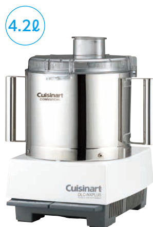
② DLC-NXJ2SS (大型) <CKI-21> G 1-0648-0201 ¥155,000