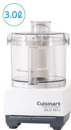
③ DLC-N7JPS (中型) <CKI-26> G 1-0648-0301 ¥95,000

※ステンレスワークボールをご使用の際は、処理量が見えないので投入量にご注意ください。