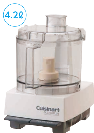
① DLC-NXJ2PS (大型) <CKI-20> G 1-0648-0101 ¥135,000