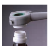
ハサミ プルタブ起こし キャップオープナー (キャップサイズ φ23~31mm)

つらごし・フルイ・ スプーン・みそこし リードル・トング・ ターナー 泡立水マス・ 調味料入・ロート マッシャー・天突 卸金すり鉢・ 和食用小物寿司・ おにぎり型 抜型細工用品・ 皮むき・玉子切 チーズ・バター! 肉用品 ハサミ・栓抜・ 缶切類 はかり・タイマー 温度計・湿度計 濃度計・塩素計類