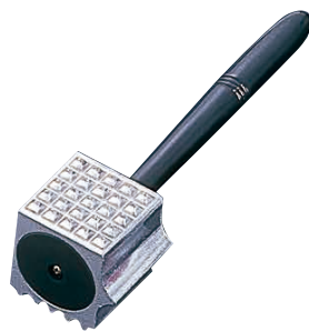
⑥ タイガー ミートハンマー No.446 〈BMC-08〉 1-0581-0601 ¥2,400 タタキ面:約52×55 全長:245