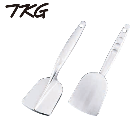
④ TKG 18-8 肉タタキ 平型 〈BNK-E4〉 1-0581-0401 ¥7,600 タタキ面:79×61 全長:204 質量:424g