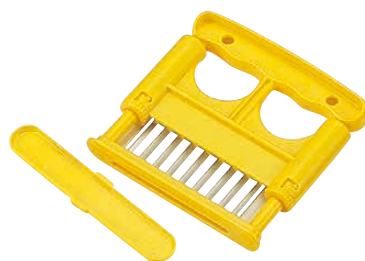
⑬ ミートソフター 〈BMC-09〉 1-0581-1301 ¥2,700 130×130 刃8列×1枚