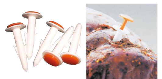
⑮ ポップアップタイマー ローストビーフ用 144S (100本入) 〈CPT-03〉 1-0581-1501 ¥8,000 φ12×H28 ●肉塊中にポップアップタイマーを差し込みます。 肉の表面から3cmの肉中温度が62°Cに達すると中心部分(オレンジ色)が飛び出して焼きあがったことを知らせてくれます。