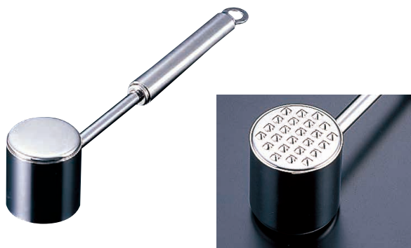
⑤ RÖSLE レズレー 18-10 両面 ミートハンマー12820 〈BMC-25〉 1-0581-0501 ¥7,500 タタキ面:φ46 全長:275