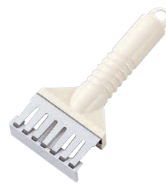
⑭ 味わい食房 お肉のすじきり器 ANS-663 〈BNK-E6〉 1-0581-1401 ¥1,000 24×62×H147 材質:本体/ABS樹脂(耐熱80°C) 刃部/18-8ステンレス