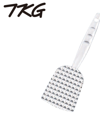
③ TKG 18-8 肉タタキ ギザ型 〈BNK-E5〉 1-0581-0301 ¥7,600 タタキ面:80×63 全長:210 質量:約420g ●握り易く、作業しやすいハンドルデザイン。