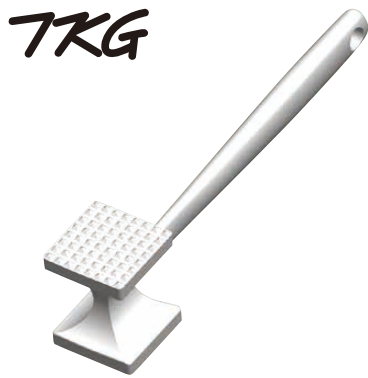
① TKG アルミダイキャスト 両面肉たたき 〈BKN-E2〉 1-0581-0101 ¥3,000 タタキ面:48×48 全長:255 310g

料理道具 調理小物 調理機械 厨房機器・設備 サービス用品 喫茶用品 軽食・鉄板焼用品 製菓用品 棚・ワゴン 洗浄用ラック 清掃用品 長靴・白衣・衛生 消耗品 バンケットウェア フラットウェア テーブルウェア 卓上備品 料理演出用品 グラス・食器 ホテル・旅館用品 テーブル・椅子 サイン 店舗備品