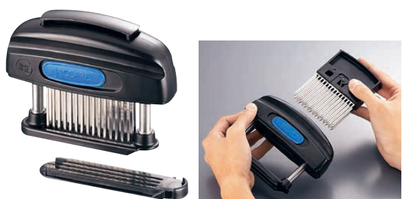
⑫ ジャカード ニューミート テンダーライザー 45刃 〈BZY-14〉 1-0581-1201 ¥14,800 47×150×H115 ●お肉を簡単に柔らかくします。 ●刃物ガイド、刃物ブロックがワンタッチで外せるので洗浄しやすく衛生的です。