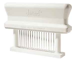
⑪ 16刃 200316 〈BZY-13〉 1-0581-1101 ¥5,500 30×145×H105 ●手軽にお肉を柔らかくします。 ※骨付き肉、半冷凍・冷凍肉用ではありません。