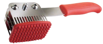
⑦ ビクター プロシェフ 56枚刃 〈BMC-30〉 1-0581-0701 ¥13,000 タタキ面:58×78 全長255 刃14列×4枚 350g ●筋きりと肉たたきを組み合わせた近代的なツールです。