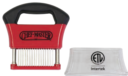
⑧ シェフ・マスター ミート テンダーライザー No.90009 〈BMC-29〉 1-0581-0801 ¥15,000 37×160×H165 刃16列×3枚