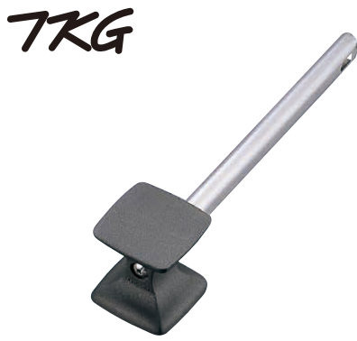
② TKG ミートテンダー(両面) アルミノンスティック M 〈BMC-28〉 1-0581-0201 ¥2,700 タタキ面:49×49 全長:250 材質 本体:アルミダイキャスト ハンドル:ステンレス ●フッ素樹脂加工で油污れも、お手入れ簡単。