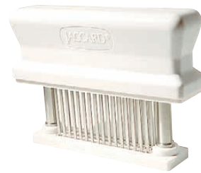
ジャカード ミートテンダーライザー ⑩ 48刃 200348 〈BZY-12〉 1-0581-1001 ¥12,800 40×145×H105