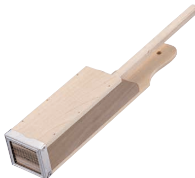
3 木製 ところ天突 特大 〈BTV-57〉 1-0534-0301 ¥4,000 内72×61×H205 目の大きさ:約5×5mm