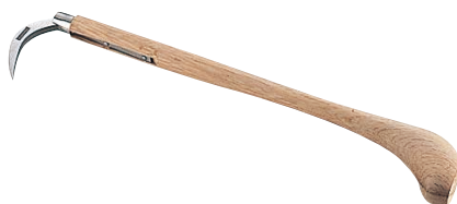
9 木柄 ステンレス 唐津鉤 〈BKZ-05〉 cm ¥ 1-0534-0901 33 8,600 1-0534-0902 36 8,800 1-0534-0903 39 9,100 1-0534-0904 42 9,700 1-0534-0905 45 10,200 1-0534-0906 54 13,200 1-0534-0907 60 13,600 1-0534-0908 75 16,000 1-0534-0909 90 17,800