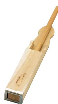
4 木製 針金天突 大 〈BTV-22〉 1-0534-0401 ¥2,200 内45×39×207 目の大きさ:約5×5mm