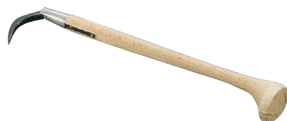
8 鯨カギ 〈BKZ-02〉 cm ¥ 1-0534-0801 30 4,600 1-0534-0802 33 4,700 1-0534-0803 36 4,900 1-0534-0804 39 5,000 1-0534-0805 42 5,100 1-0534-0806 45 5,500 1-0534-0807 48 6,000 1-0534-0808 51 6,500 1-0534-0809 54 6,900 1-0534-0810 57 7,400 1-0534-0811 60 7,400 1-0534-0813 90 11,000