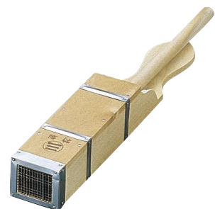
1 木製 業務用天突 〈BTV-01〉 1-0534-0101 ¥5,500 内44×37×204 目の大きさ:約3×3mm

つらごし・フルイ・スプーン・みそこし レードル・トング・ターナー 泡立水マス・卸金すり鉢・調味料入・ロート マッシャー・天突 和食用小物・寿司・おにぎり型 抜型・細工用品・皮むき・玉子切 チーズ・バター・肉用品 ハサミ・栓抜 はかり・タイマー 温度計・湿度計 濃度計・塩素計類