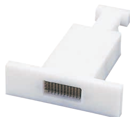
6 PP 抗菌こんにゃく突 抗菌 〈BKV-31〉 1-0534-0601 ¥24,000 内73×30×178 目の大きさ:約6×6mm ●無機系抗菌剤使用でカビ・黒ズミ・ヌメリをおさえます。 ●乾きが早く雑菌の繁殖を防ぎます。 ※抗菌剤が入っていますので、変色することがあります。