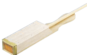
5 木製 ところ天突(真鍮刃) 〈BTV-77〉 1-0534-0501 ¥2,400 内39×25×160 ●目の大きさ:約3×4mm