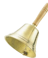
13 真鍮 手振鈴 〈BSZ-01〉 mm 全高 ¥ 1-0534-1301 100 190 14,700 1-0534-1302 110 200 16,000 1-0534-1303 125 215 17,500 1-0534-1304 145 235 20,600