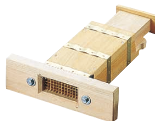
7 DX 木製 こんにゃく突 〈BKV-03〉 1-0534-0701 ¥16,000 内70×30×190 目の大きさ:約6×6mm