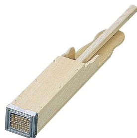
2 木製 天突 〈BTV-02〉 1-0534-0201 ¥1,800 内35×30×190 目の大きさ:約4×4mm