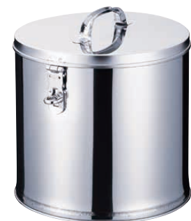
14 ステンレス フブの肝入れ容器 NEW 〈BKM-11〉 1-0534-1401 ¥19,500 内φ240×H255 ※⑫錠を必要とします。(別売)