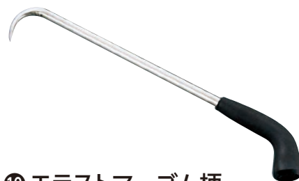
10 エラストマーゴム柄 ステンレス手鉤 〈BTK-25〉 cm ¥ 1-0534-1001 30 16,000 1-0534-1002 36 17,400 1-0534-1003 39 18,600 1-0534-1004 45 19,800 1-0534-1005 60 21,900