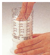
筒からカップを離す

φ60×H103 容量:200c.c. 最小目盛:10c.c. 材質:本体/ポリエチレン樹脂 筒/AS樹脂 ●一目でわかるすっきりしたデザイン。何を計ってもすりきり一杯、一番正確で使いやすい。お菓子作りにはかかせません。 ※イメージ写真の目盛は黒ですが現品はすべて赤です。