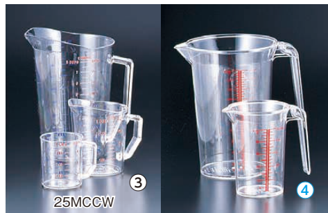
③ キャンブロ 計量カップ (ポリカーボネイト) (BKI-15)