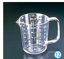
⑫ 計量カップ PP-515 (BKI-42)

φ104×H117 材質: メタクリル樹脂 耐熱温度: 80℃ 液体(水・油など) 500c.c.・小麦粉約250g・片栗粉約300g・砂糖約300gが計れる便利な計量カップ。目盛り白文字・黒文字の2色で印刷してあり、大変見易い設計。最小目盛: 50c.c.