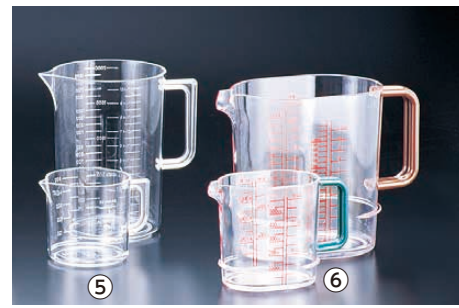
⑤ アクリル 水マス (BMZ-04)