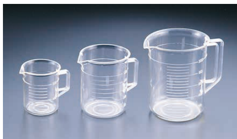
⑧ TPX手付ビーカー (BBC-04)