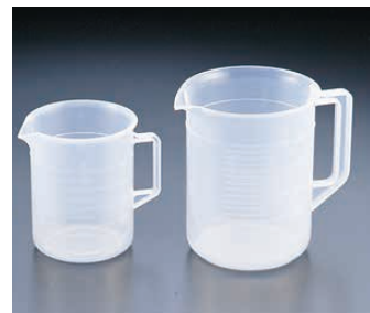
⑨ ポリプロピレン 手付ビーカー (BBC-05)