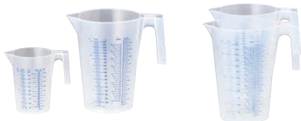
⑩ サーモ PPスタッキング メジャーカップ (BMZ-41)