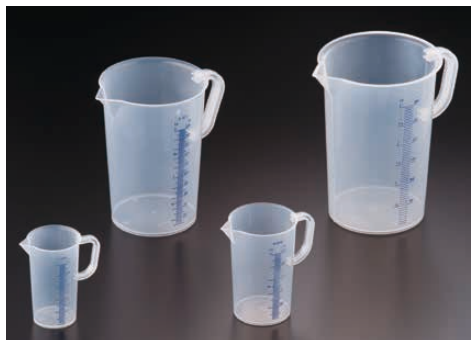
⑦ ドイツ製 メジャーカップ(ポリプロピレン) (BMZ-12)