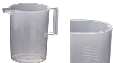
⑩ ポリプロ 計量カップ (BMZ-50)