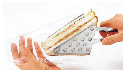
袋に入れやすく、取り分けにも便利。

㉓ 18-8 サンドイッチトン 〈BTV-26〉 1-0499-2301 ¥3,320 全長:238