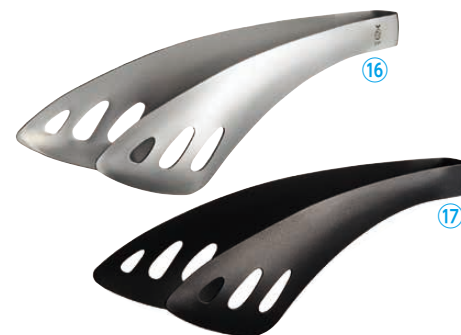
18-0 ゆびさきサーバートング ⑯ LS1514 〈BTV-N6〉E 1-0494-1601 ¥2,000 全長：210