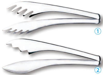
① アベルト スパゲティトング 〈BAB-07〉E 1-0494-0101 ¥3,200 全長：250

従来のサーバートングの実用性だけでなくイタリアデザインにこだわりホテルレストランやビュッフェでのシーンやケータリングサービスなど幅広く活用できるラインナップを揃えました。