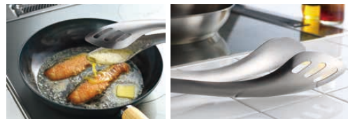
片側が深いのでソースがひっくり返すと先端が浮くので、すくえます。衛生的に使用できます。