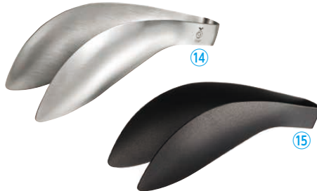
18-0 ゆびさきトング ⑭ LS1505 〈JOY-57〉E 1-0494-1401 ¥1,500 全長：147