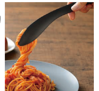
⑪ ブラック AUT1404 〈BTV-N4〉E 1-0494-1101 ¥3,000 全長：250 ●フッ素コーティングにより汚れがつきにくく、落としやすいです。 ⑩⑪ ●先端が細く、パスタやサラダをきれいに盛りつけることができます。 ●ひっくり返すと先端が浮くので、衛生的に使用できます。