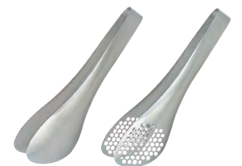
⑱ 柳宗理 18-8トング 〈BTV-C6〉E 1-0494-1801 穴なし ¥1,800 1-0494-1802 穴あき ¥2,000 全長：220

つらごし・フルイ・レードル・トング・ターナー 泡立水マス・調味料入・ロート 卸金すり鉢・マッシャー・天突 和食用小物寿司・おにぎり型 抜型細工用品・皮むき・玉子切 チーズ・バター！ ハサミ・栓抜 はかり・タイマー 温度計・湿度計 濃度計・塩素計類