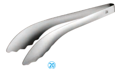
20 18-0 しっかりめんトング LES3242 〈BTV-O3〉E 1-0494-2001 ¥2,200 全長：250 ●先端のギザギザでつかみやすく、大量の麺も、最後の一本もしっかりつかめます。 ●上部はなめらかな形状で麺がからまりにくいです。