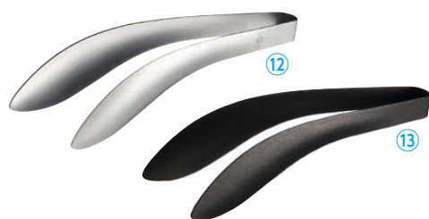
18-0 ごはんのおともトング ⑫ LS1536 〈BTV-K5〉E 1-0494-1201 ¥1,400 全長：135