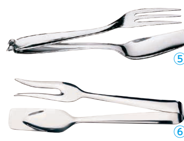
⑤ アベルト ユニバーサルトング 〈BAB-11〉E 1-0494-0501 ¥2,800 全長：235