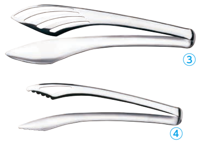
③ アベルト ドルチェトング L 〈BAB-09〉E 1-0494-0301 ¥3,200 全長：250