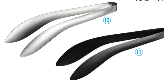
18-0 もりつけトング ⑩ LS1535 〈BTV-K4〉E 1-0494-1001 ¥2,200 全長：250