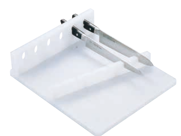
⑬ PE 6本用水平式 庖丁置き台