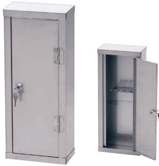
① TKG 18-8鍵付包丁ロッカー 4本用