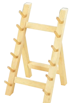
⑰ 木製 6段庖丁掛