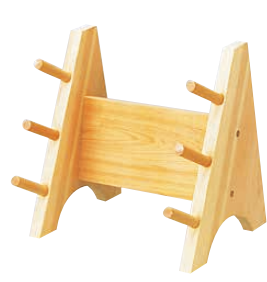
⑮ 木製 3段庖丁掛