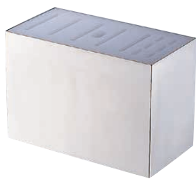
⑩ 18-8中華庖丁差 横型