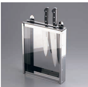
⑤ 18-0 釘打式ゴム板付 前面アクリル庖丁差 大1段