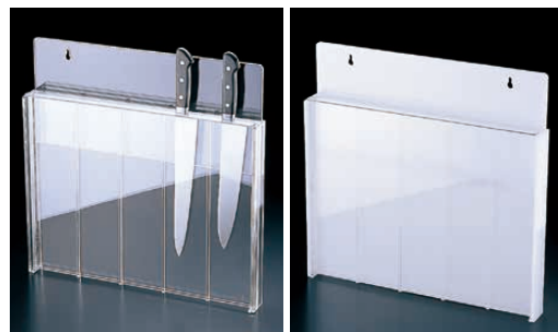
⑥ アクリル 庖丁スタンド(釘打式)

303×60×H405 ●中が見えるので、使いたい庖丁を簡単に取り出せます。 ●最大刃渡り330mmまで使用可能です。