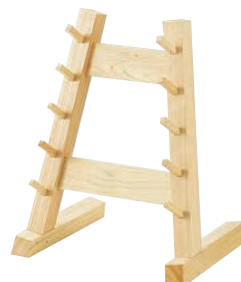
⑯ 木製 5段庖丁掛