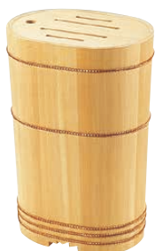
⑭ 木製 庖丁差