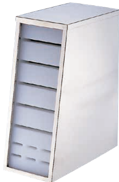
⑪ 18-8 中華庖丁差 斜め型