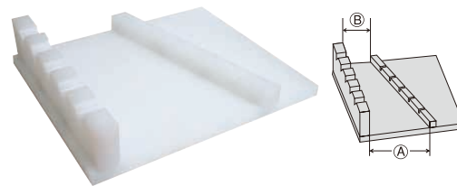
⑫ PE ニュー5本用 水平式 包丁置き台