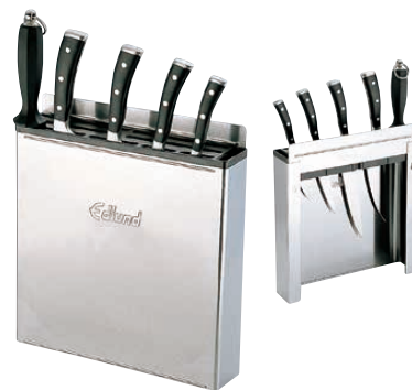
⑦ 18-10エドランド ナイフラック (釘打式) KR-699