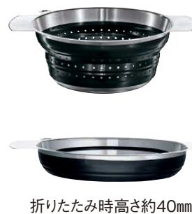
折りたたみ時高さ約40mm