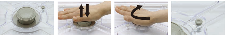
ビルトイン型ポンプ

※DO-ENホテルパン専用です。他のホテルパンへのご利用はご遠慮下さい。(P.111)