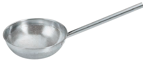
② UK 18-8パンチング丸型スクイ玉揚 <ASK-56>