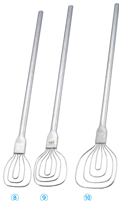
のじ 18-8オールステンレス調理用ビッグターナー (柄長100cmタイプ)