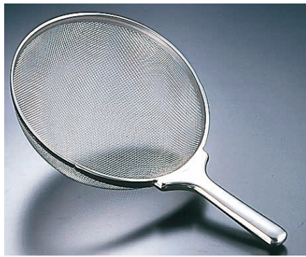
① Ω18-8 ジャンボ スクイざる (10メッシュ) <ASK-08>