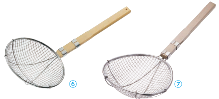
TS ステンレス 極荒すくい網 ⑥ 丸型 24cm (18-8アミ・2.5メッシュ)