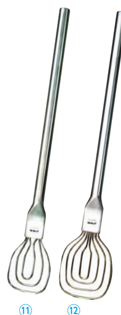
のじ 18-8オールステンレス調理用ビッグターナー (柄長60cmタイプ)