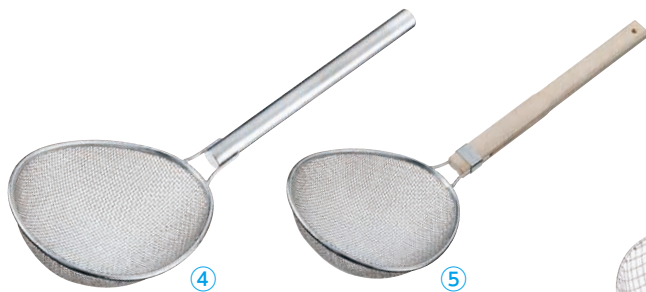
TS ステンレス プロすいのう (18-8アミ・6.5メッシュ)