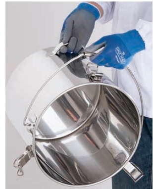
●中身を空ける際に下部の取っ手を掴む事で容器を楽に傾けられます。