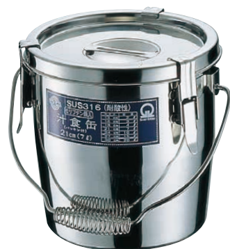
① Ωモリブデン パッキン付汁食缶 (シリコンゴム) <ASY-07>