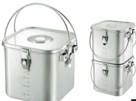
⑦ KO19-0 角型 給食缶 <AKY-64>