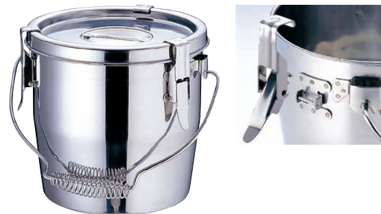
② Ωモリブデン フック脱着式汁食缶 (シリコンゴム) <ASY-97>