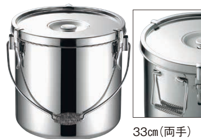
⑤ KO19-0 電磁調理器対応給食缶 <ASY-D3>