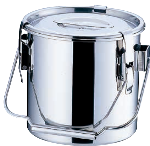
④ UK モリブデンパッキン付汁食缶 16cm (目盛付)