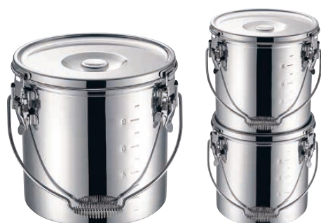
⑥ KO 19-0 電磁調理器対応 スタッキング給食缶 <ASY-G6>