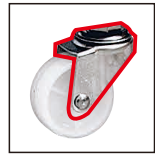
キャスター金具部分 ステンレス