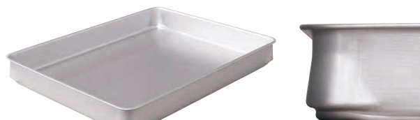
⑪ アルミ スタッキングバット (AST-M1) □