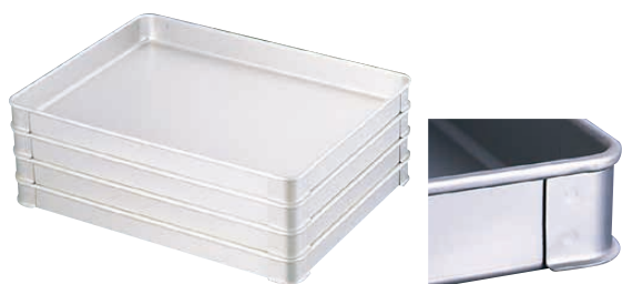
⑩ アルミ システムバット L型 (ASS-05) □