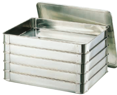
② 18-8 システムバット(餃子バット) (AGY-40)

●足金具に工夫をし、L型にしました。スタッキングも良好でかつ途中のバットを簡単に引き抜くことが出来ます。底に出っぱっていないため冷蔵庫への出し入れも非常に楽です。