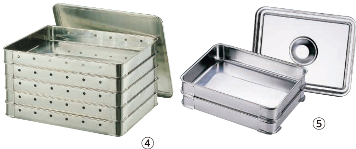
④ Ω 18-8 餃子バット 穴明 (AGY-05)