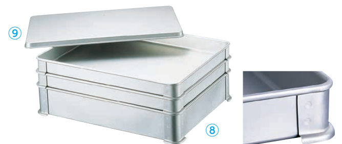
⑧ アルミ システムバット(AGY-07) □

アルミ システムバットは硬質アルミ(AS5005材)使用で、丈夫で、スピーディーに安全にストックできます。(⑧、⑨)