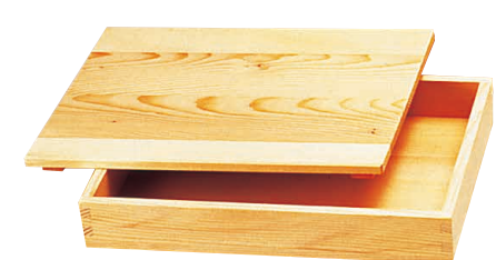
⑫ 白木 餃子バット(AGY-33) □