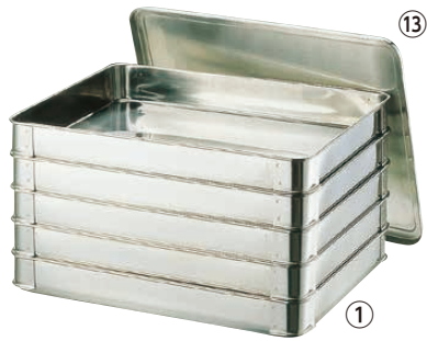
① ステンレス システムバット(餃子バット) (ASS-14)