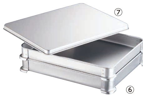
⑥ ホクア アルマイト アレンジバット (AAL-48)