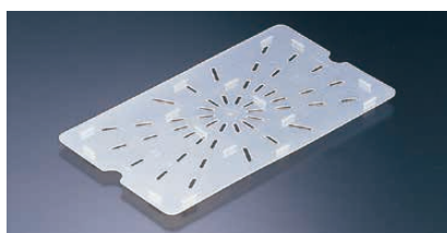
⑤ 半透明フードパン用 ドレンシェルフ(水切目皿) 〈AHC-52〉