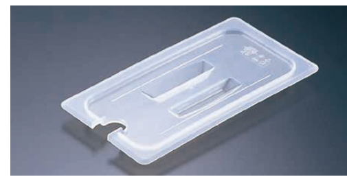
③ 半透明フードパン用 切込・取手付カバー 〈AHC-54〉