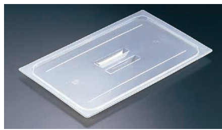
② 半透明フードパン用 取手付カバー 〈AHC-53〉