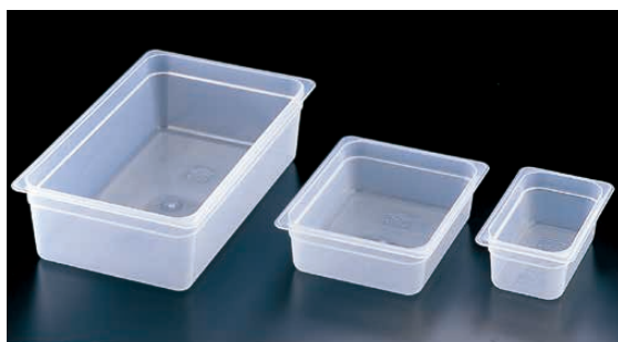
① 半透明フードパン 〈AHC-51〉