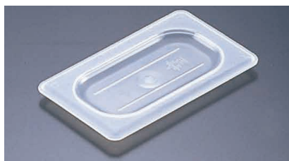
④ 半透明フードパン用 平面カバー 〈AHC-55〉