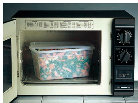
食材を移すことなくそのまま電子レンジへ。