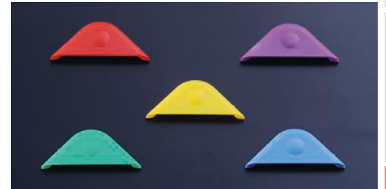
カラークリップで分類