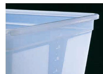
各コンテナの側面には一目でわかる便利な目盛付。