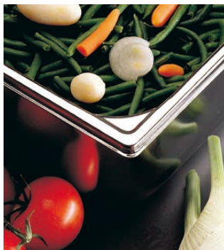
コーナーに三角形の凹を入れることにより、強度を持たせ、よじれ等を防ぎます。