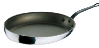
⑮ モービル シルバーストーン オーバルパン 〈AOC-04〉