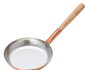
① TKG アルミ厚板 ノンスティック フライパン 〈AHL-AB〉