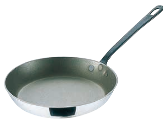
⑭ モービル シルバーストーン フライパン 〈AHL-13〉