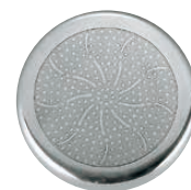
電磁調理器対応底 (1)(2)