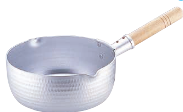
④ エコクリーン アルミ エレテック 雪平鍋 (本体内面ゼロクリア2コート加工) <AEK-70>