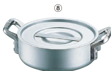
⑧ エレテック 外輪鍋 <AST-11>