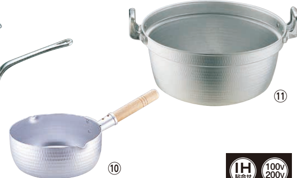
⑩ エレテック アルミ雪平鍋 <AYK-03>