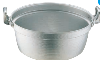
⑤ エコクリーン アルミ エレテック 円付鍋 (本体内面ゼロクリア2コート加工) <AEK-69>