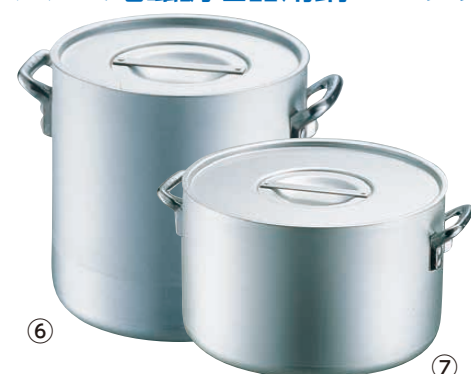
⑥ エレテック 24cm 胴鍋 <AZV-04>