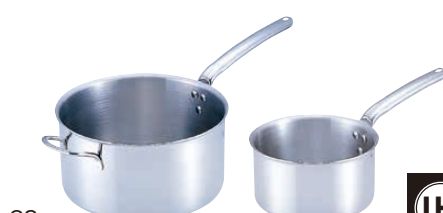
⑨ 18-10 プライオリティ 片手深型鍋 (蓋無) 3690 (AST-E4)