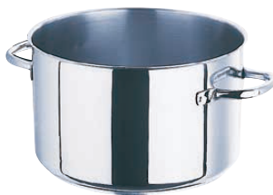
② 半寸胴鍋 (蓋無) 5935 (AHV-60)