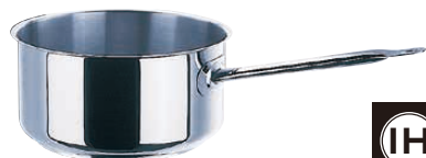
④ 片手深型鍋 (蓋無) 5930 (AKT-75)