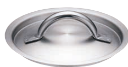
⑭ 18-10 デバイヤー 鍋蓋 3509 (ANB-44)