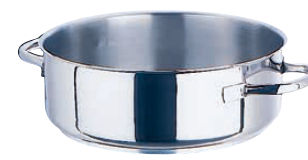
③ 外輪鍋 (蓋無) 5937 (AST-C7)