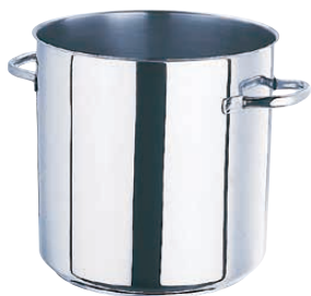
① 寸胴鍋 (蓋無) 5933 (AZV-26)

※①~⑦(⑥のぞく) 底板厚: 14cm~28cm 5mm 32cm以上 6mm サイド板厚: 0.8mm~1mm