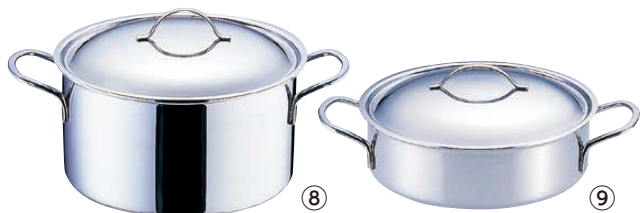
⑧ 18-10 プライオリティ 半寸胴鍋 (蓋付) 3694 (AHV-66)