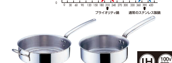
⑩ 18-10 プライオリティ 片手浅型鍋 (蓋無) 3691 (AST-E5)