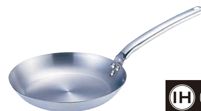
⑮ 18-10 プライオリティ フライパン 3680 (AHL-P9)