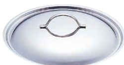
⑬ 18-10 プライオリティ 鍋蓋 3459 (ANB-26)