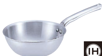
⑫ 18-10 プライオリティ テーパーパン 3692 (AST-E7)

⑧⑨底板厚: 2.0 ※コイル径φ24cmの電磁調理器には32cmはご使用できません。