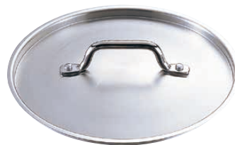
⑦ TKG PRO(プロ) 鍋蓋 〈ANB-24〉