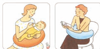
赤ちゃんのミルクタイムに。読書時の腕の支えに。

550×420×H150 材質:中身/ポリエステル カバー/綿30%・ポリエステル70%