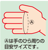
①は手のひら周りの目安サイズです。

全長:約270 材質:ポリプロピレン 1箱(500枚入):使いすて用 ●五本絞りで指の付け根までぴったりフィットします。