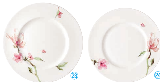
㉓ 31161 サービスプレート 31cm 〈RLC-S7〉G 9-2335-2301 ¥12,000 D:310 H:23