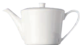
⑳ 34211 ティーポット 400c.c. 〈RLC-L8〉G 9-2335-2001 ¥10,000 L:190 S:107 H:102