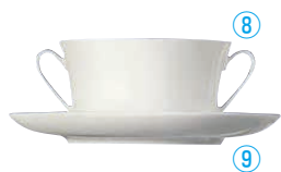
⑧ 30479 ブイヨンカップ 350c.c. 〈RLC-L0〉G 9-2335-0801 ¥5,500 D:113 H:61