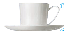
⑪ 34812 デミタスカップ 100c.c. 〈RLC-L6〉G 9-2335-1101 ¥1,700 D:62 H:54