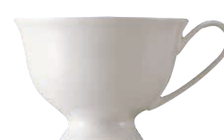
⑲ 34772 兼用カップ 180c.c. 〈RLC-M1〉G 9-2335-1901 ¥2,400 D:95 H:68