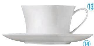
⑬ 34642 ティーカップ 220c.c. 〈RLC-L2〉G 9-2335-1301 ¥2,200 D:94 H:60