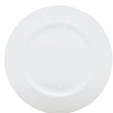
① 31161 サービスプレート 31cm 〈RLC-K8〉G 9-2335-0101 ¥7,500 D:310 H:23