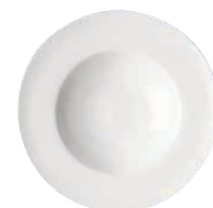
⑥ 31116 リムプレート 16cm 〈RLC-K3〉G 9-2335-0601 ¥2,000 D:159 H:14