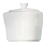
㉑ 34341 シュガーポット 250c.c. 〈RLC-L9〉G 9-2335-2101 ¥5,400 D:99 H:95