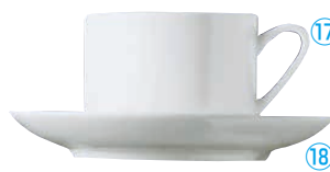
⑰ 34674 スタッキングカップ 200c.c. 〈RLC-M0〉G 9-2335-1701 ¥2,200 D:75 H:58