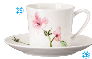
㉕ 34749 コーヒーカップ 200c.c. 〈RLC-S9〉G 9-2335-2501 ¥4,800 L:103 S:78 H:68