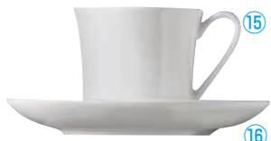
⑮ 34749 コーヒーカップ 200c.c. 〈RLC-L4〉G 9-2335-1501 ¥2,200 D:78 H:68