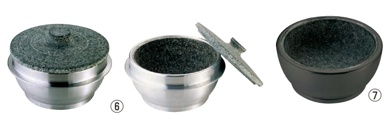
⑥ アルミ枠付長水石焼釜(フタ付き)〈QKM-59〉