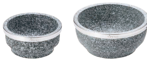
② 長水石焼ピビンバ器(補強付き)〈QPB-08〉