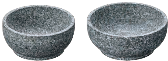
① 長水石焼ピビンバ器(補強なし)〈QPB-02〉