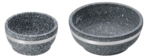
③ 長水石焼ピビンバ器(補強付き)〈QPB-01〉