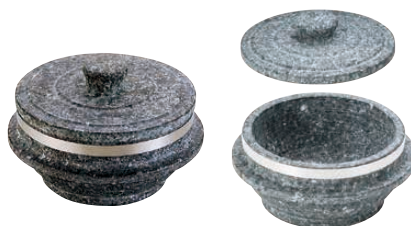
⑤ 長水石焼釜 補強付(フタ付き)〈QKM-58〉

炊き込みご飯や、チゲ料理、その他一人前の鍋物など…。ふた付きなので料理の温かさを逃しません。