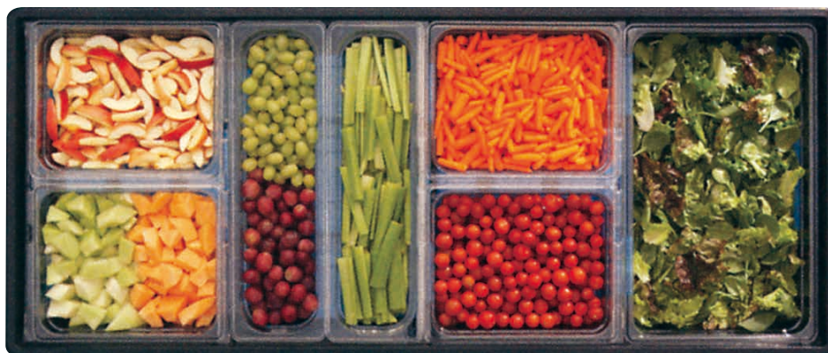
フードバーセットアップ例

スペースを最大限に利用し、お客様の流れをスムーズにし、商品陳列スペースを増やし、ハイセンスなサラダバーを提供出来ます。スーニーズガードは可変式なのでセットアップや掃除が簡単に出来、時間がかかりません。