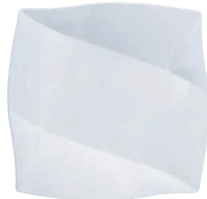
⑬ 50180-5152 30cm折り紙 プレート 〈RST-22〉 9-1665-1301 ¥9,300 300×300×H38