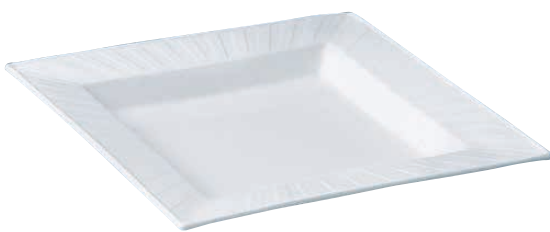
⑫ 50180-5153 34cm角深鉢 〈RST-21〉 9-1665-1201 ¥17,000 345×345×H48