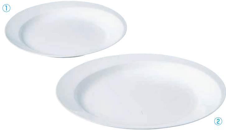
① 50180-5173 36cmラウンド リムプレート 〈RST-10〉 9-1665-0101 ¥14,000 φ360×H46