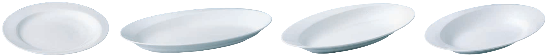
③ 50180-5174 31cmラウンド リムプレート 〈RST-12〉 9-1665-0301 ¥9,200 φ314×H35