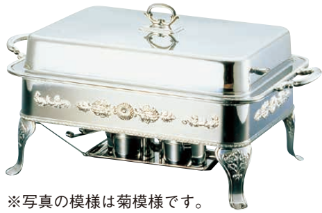
※写真の模様は菊模様です。

料理道具 調理小物 調理機械 厨房機器・設備 サーブ用品 喫茶用品 軽食・鉄板焼用品 製菓用品 棚・ワゴン 洗濯用品 清掃用品 長靴白衣・衛生 消耗品 バンケットウェア フラットウェア テーブルウェア 卓上備用品 料理演出用品 グラス・食器 ホテル・旅館用品 椅子 サイン 店舗備用品