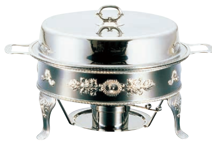
※写真の模様は菊模様です。