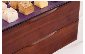
切込み付きで皿の入替が容易です。