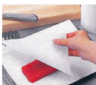
鮮魚・精肉のドリップ取り