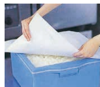
炊飯米の湯気取り