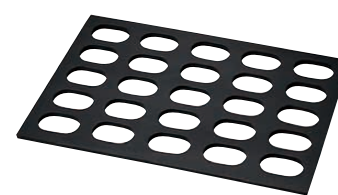
⑪ ゴム製 小判ダコワーズ 〈WDK-24〉 1ヶ当たり 9-1112-1101 6枚取用 (25穴) 495×345×H10 (内70×45) ¥32,000 9-1112-1102 8枚取用 (20穴) 390×302×H10 (内64×42) ¥27,000 耐熱温度: -40℃~120℃