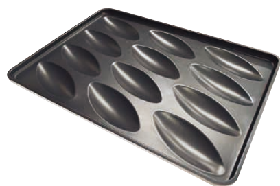
⑫ NEW 塩パン型天板 6枚取 PYJ006 〈WTV-C4〉 9-1112-1201 ¥8,800 530×380×H33 (1ヶ当たり 内170×66×H15) 材質:アルミメッキ鋼板(フッ素加工)