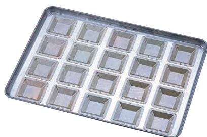
④ シリコン加工 カトラー70型 天板 20連 〈WTV-79〉 9-1112-0401 ¥31,500 545×395×H34 単品寸法 (A) (B) (H) 内 70×70×12