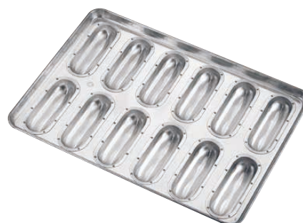
⑧ シリコン加工 シュトーレン 天板 12連 〈WTV-B4〉 9-1112-0801 ¥34,500 545×395×H57 単品寸法 (A) (B) (H) 内 160×53×35