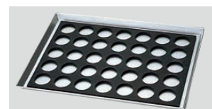
●6枚取・8枚取天板にセット できます。

天板・シリコンマット デコレクター! 絞り袋・スパチュラ チョコレート用品 ハケゴムヘラ