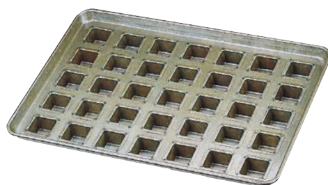
⑦ シリコン加工 フォーマル型 天板 (35ヶ取) 〈WTV-14〉 9-1112-0701 ¥39,500 545×395×H54 単品寸法 (A) (B) (H) 内 45×45×30