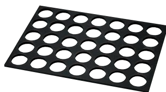
⑩ ゴム製 丸ダコワーズ 〈WDK-23〉 1ヶ当たり 9-1112-1001 6枚取用 (35穴) 500×345×H10 (内φ55) ¥32,000 9-1112-1002 6枚取用 (25穴) 500×345×H10 (内φ55) ¥32,000 9-1112-1003 8枚取用 (20穴) 395×302×H10 (内φ55) ¥27,000