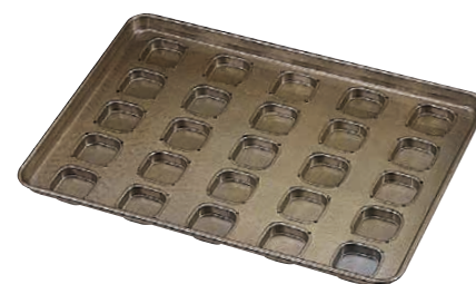
⑥ シリコン加工 サボン型 天板 (25ヶ取) 〈WTV-13〉 9-1112-0601 ¥33,500 545×395×H39 単品寸法 (A) (B) (H) 内 54×54×15