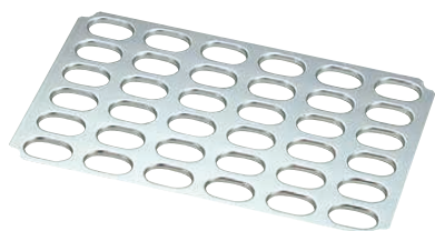
⑨ マトファ ダコワーズ 791749 (アルミ) 〈WDK-14〉 9-1112-0901 ¥14,500 500×360×H8 (1ヶ当たり 内 60×40)