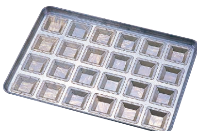
⑤ シリコン加工 カトラー60型 天板 24連 〈WTV-80〉 9-1112-0501 ¥33,000 545×395×H34 単品寸法 (A) (B) (H) 内 60×60×12