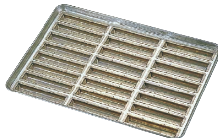
② シリコン加工 ラフト型 天板 (24ヶ取) 〈WTV-70〉 9-1112-0201 ¥36,500 545×395×H38 単品寸法 (A) (B) (H) 内 150×26×18