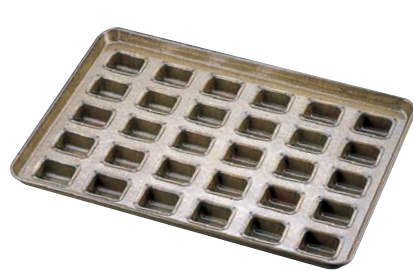
① シリコン加工 ホール型 天板 (30ヶ取) 〈WTV-32〉 9-1112-0101 ¥38,500 542×393×H53 単品寸法 (A) (B) (H) 内 52×42×30