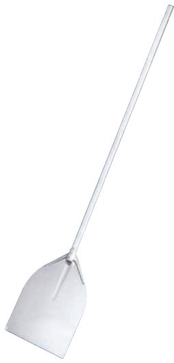
① AM アルミピザピール スモール〈GPZ-30〉

ファーストフード 関連品 テイクアウト商品 使い捨て容器 たこ焼・饅頭焼 お好み焼・鉄板焼 アウトドア用品