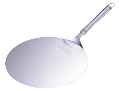
⑧ シェフランド ビッグピザサーバー 〈GBT-03〉