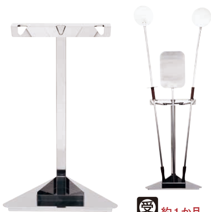
⑨ UK 18-8 ピザピールラック 〈GPZ-44〉 9-0964-0901 ¥69,900 550×400×H850 5.9kg 収納本数:3本