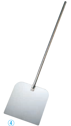
④ デバイヤー 18-10 ピザピール角型 3293-31 〈WPZ-16〉 9-0964-0401 ¥20,000 310×310×全長1,265