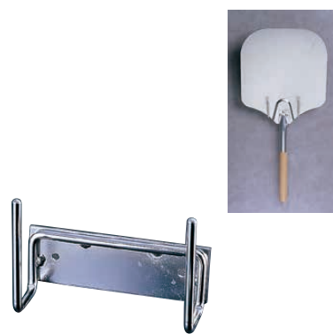
⑩ AM ピザピールラック WPH45153 〈GPZ-16〉 9-0964-1001 ¥6,600 115×45 (27) ×H80 ● クロームメッキ ● 壁面にラックを取り付けて使用します。