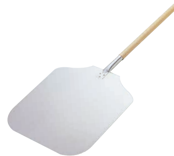
⑦ 木柄 アルミ ピザピール 〈WPZ-12〉