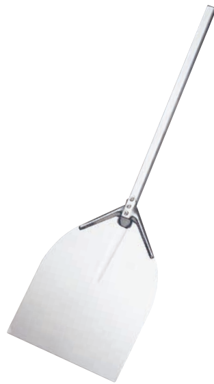
② AM アルミピザピール ミディアム〈GPZ-31〉