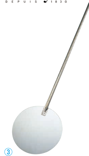
③ デバイヤー 18-10 ピザピール 3290-31 〈WPZ-14〉 9-0964-0301 ¥18,000 φ310×全長1,255