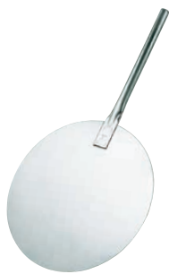
⑤ UK 18-8 ピザピール 丸 短柄〈GPZ-29〉