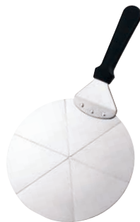
⑥ UK アルミピザサーバー 〈GPZ-43〉