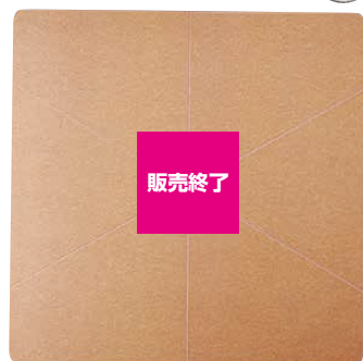
⑪ リード イコール ピザスライスボード ES-2020-8 (8等分) 〈WPZ-50〉 販売終了 ¥18,000 510×510×H8 ● 表面は滑らかで汚れがつきにくく衛生的です。 ● とても丈夫で長持ちします。