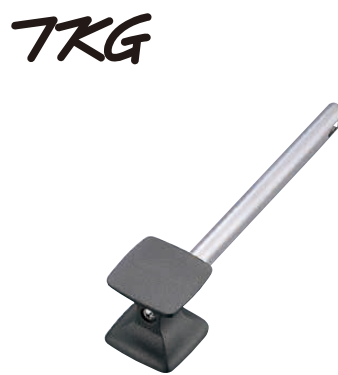
② TKG ミートテンドー(両面) アルミノスティック M 〈BMC-28〉 9-0580-0201 ¥2,700 タタキ面:49×49 全長:250 材質 本体:アルミダイキャスト ハンドル:ステンレス ●フッ素樹脂加工で油污れも、お手入れ簡単。