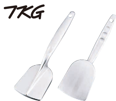
④ TKG 18-8 肉タタキ 平型 〈BNK-E4〉 9-0580-0401 ¥7,000 タタキ面:79×61 全長:204 質量:424g