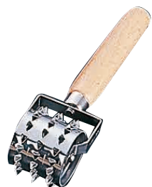
⑩ 木柄 ミートローラー 〈BMC-10〉 9-0580-1001 ¥850 幅50×全長180