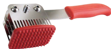
⑧ ビクター プロシェフ 56枚刃 〈BMC-30〉 9-0580-0801 ¥9,500 タタキ面:58×78 全長255 刃14列×4枚 350g ●筋きりと肉たたきを組み合わせた近代的な ツールです。