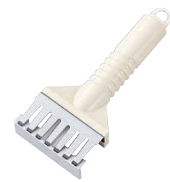
⑨ 味わい食房 お肉のすじきり器 ANS-663 〈BNK-E6〉 9-0580-0901 ¥1,000 24×62×H147 材質:本体/ABS樹脂(耐熱80℃) 刃部/18-8ステンレス