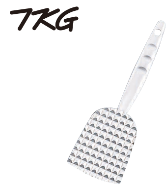
③ TKG 18-8 肉タタキ ギザ型 〈BNK-E5〉 9-0580-0301 ¥7,000 タタキ面:80×63 全長:210 質量:約420g ●握り易く、作業しやすいハンドルデザイン。