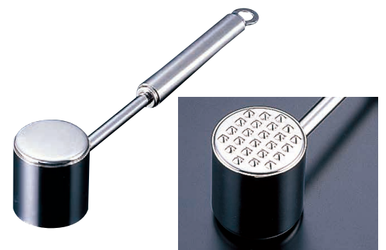
⑥ RÖSLE レズレー 18-10 両面 ミートハンマー12820 〈BMC-25〉 9-0580-0601 ¥7,500 タタキ面:φ46 全長:275