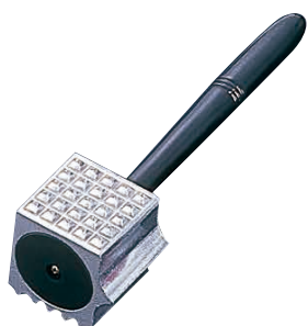
⑦ タイガー ミートハンマー No.446 〈BMC-08〉 9-0580-0701 ¥2,200 タタキ面:約52×55 全長:245