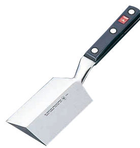
⑤ WÜSTHOF ヴォストフ ステンレス ミートハンマー 4701 〈BHV-39〉 9-0580-0501 ¥46,500 86×140 全長:310