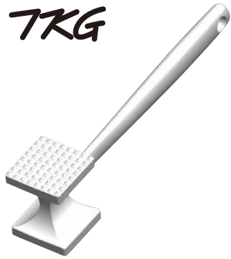
① TKG アルミダイキャスト 両面肉たたき 〈BKN-E2〉 9-0580-0101 ¥3,000 タタキ面:48×48 全長:255 310g