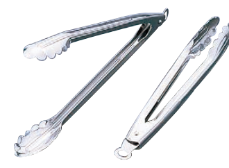
⑦ 18-0 ストッパー付 万能トング4384 〈BTV-38〉