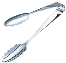
⑨ Ω 18-0 リーフトング 〈BHC-02〉