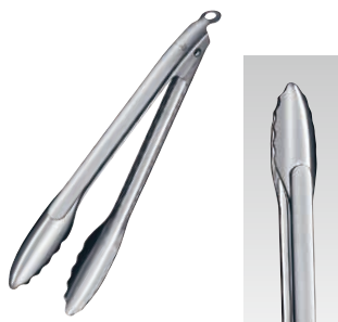
⑬ RÖSLE レズレー 18-10 ロッキングトング 〈BTV-D8〉