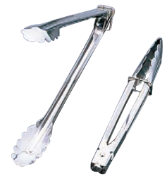
⑧ 18-0 リングストッパー付 万能トング 4516 〈BTV-43〉