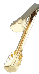
③ Ω 18-0 万能トング (金メッキ付) 〈BBV-18〉