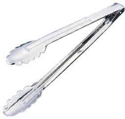
⑤ エコクリーン 18-0 万能トング 〈BEK-08〉