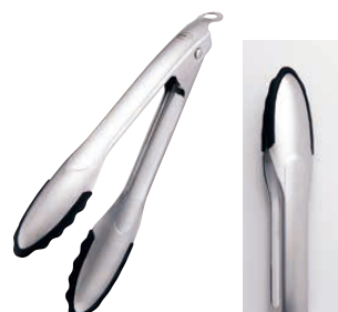
⑭ RÖSLE レズレー ロッキングトング シリコンガード NEW 〈BTV-M1〉