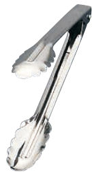
② Ω 18-0 厚口 万能トング 〈BBV-04〉 9-0486-0201 ¥380