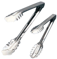
① Ω 18-0 万能トング 〈BBV-03〉