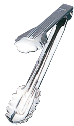
⑥ IKD 18-8 抗菌万能トング 〈BKU-09〉