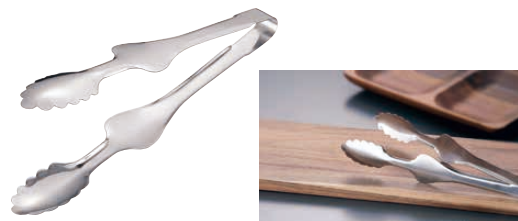
⑩ ステンレス リーフマルチトング 〈BTV-L8〉 9-0486-1001 ¥1,200

全長:240 ● どちら向きに置いても先端がテーブルに触れない衛生的な構造。 ● やわらかくバネ性があり、お子様、女性にやさしいソフトタッチ仕様。