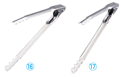
⑯ エコクリーン 18-0 ニュー万能トング 〈BKU-18〉