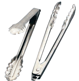
④ 18-0 エドランド 万能トング 〈BBV-08〉