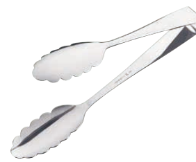
⑮ エコクリーン 18-8 ロール式厚口1pc 万能トング 〈BEK-43〉