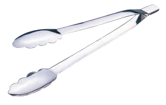
⑫ 18-8 ウェルド 万能トング 〈BTV-62〉

● テーブルや調理台に置いた時に先端が触れないので衛生的です。 ● ステンレスはSUS304と同等の新素材ステンレス(SUS821L1)を採用し、高強度、高耐食性に優れています。