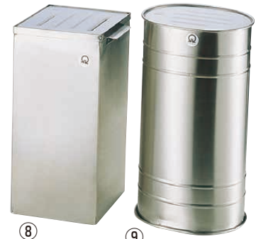
⑧ Ω 18-8 角型 庖丁桶

305×68×H310 有効高さ:300 ●背面が開いているので洗いが簡単です。 ※写真の庖丁は別売です。