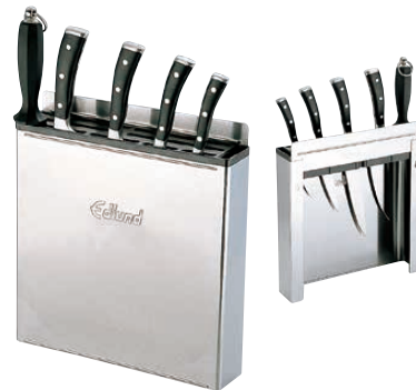
⑦ 18-10エドランド ナイフラック (釘打式) KR-699