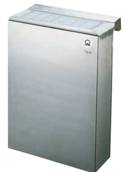
④ Ω 18-8 流掛式 縦型 庖丁差 (AHU-34)

9-0386-0401 ¥22,000 300×105×H420 ●流掛幅最大47mmまで可能です。