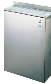
③ Ω 18-8 釘打式 縦型 庖丁差 (AHU-33)

〈AHU-A2〉 9-0386-0201 ¥29,000 306×108×H503 収納数:牛刀5本 ペティー2本