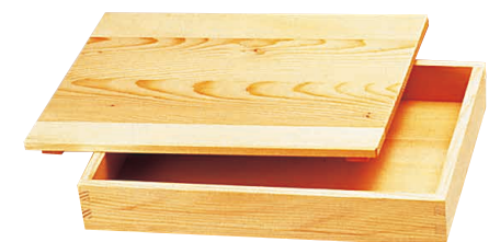
⑫ 白木 餃子バット 〈AGY-33〉