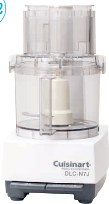
② DLC-N7JPG (中型) 〈CKI-24〉 9-0643-0201 ¥115,000