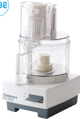
③ DLC-10PRO 〈CKI-15〉 9-0643-0301 ¥48,000