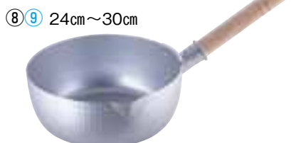
⑨ エコクリーン ホクア アルミ打出雪平鍋 (内面ゼロクリア2コート加工) (AEK-10)