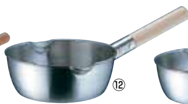
⑫ 18-8 木柄 計量 雪平鍋 (両口・目盛付) (AYK-10)