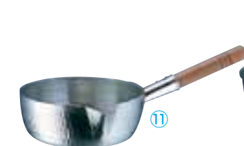
⑪ アルミDON カラス口 雪平鍋 (AYK-06)