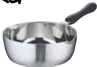
① TKG クラッド プラ柄雪平鍋 (AYK-81)