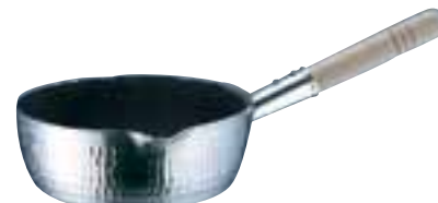
③ TKG IH プロセレクト 雪平鍋 (AYK-60)