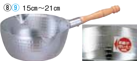
⑧ ホクア アルミ打出雪平鍋 (目盛付) (AYK-55)