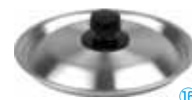
⑯ アルミ 雪平鍋用蓋 (AHT-38)