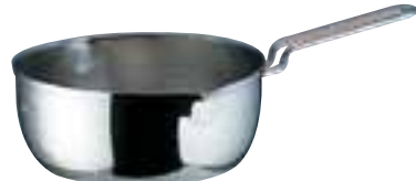
② Ω18-10 共柄三層鋼 雪平鍋 (目盛付) (AYK-52)