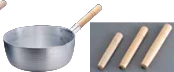
⑤ Ωアルミ 雪平鍋 (両口) (アルマイト加工) (AYK-04)