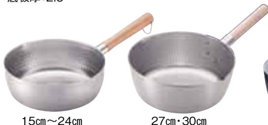
④ Ω21-0 打出 雪平鍋 (両口) (AYK-49)