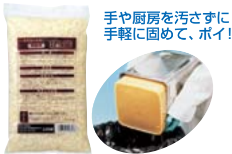
手や厨房を汚さずに 手軽に固めて、ポイ!